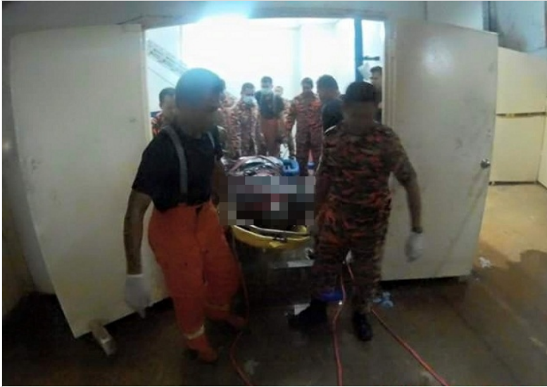
消拯员在耗时近1小时才成功將死者遗体移出，送往马大医院剖验。（图取自消拯局面子书）

（吉隆坡14日讯）一名失踪数天的中年华裔男子日前被发现离奇卧尸公寓水槽内，逾200户公寓居民不知情下或已饮尸水5天！